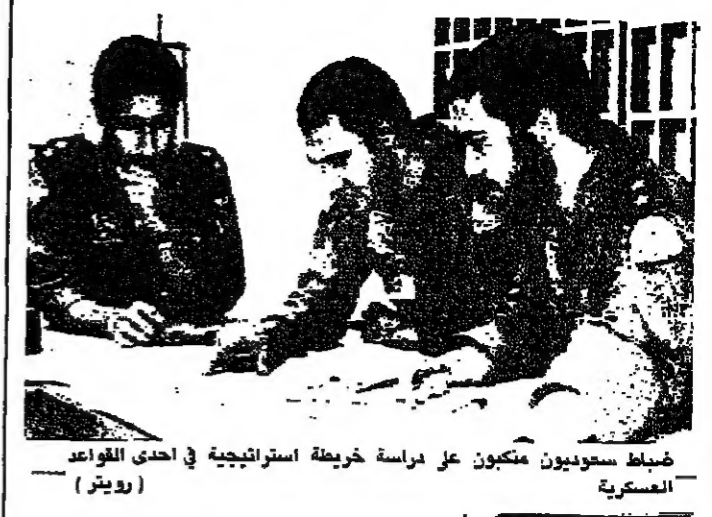
ضباط سعوديون متمركزين على مرسة خريطة استراتيجية في إحدى القواعد العسكرية